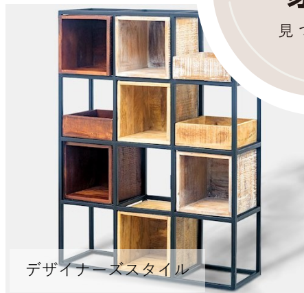
デザイナーズスタイル